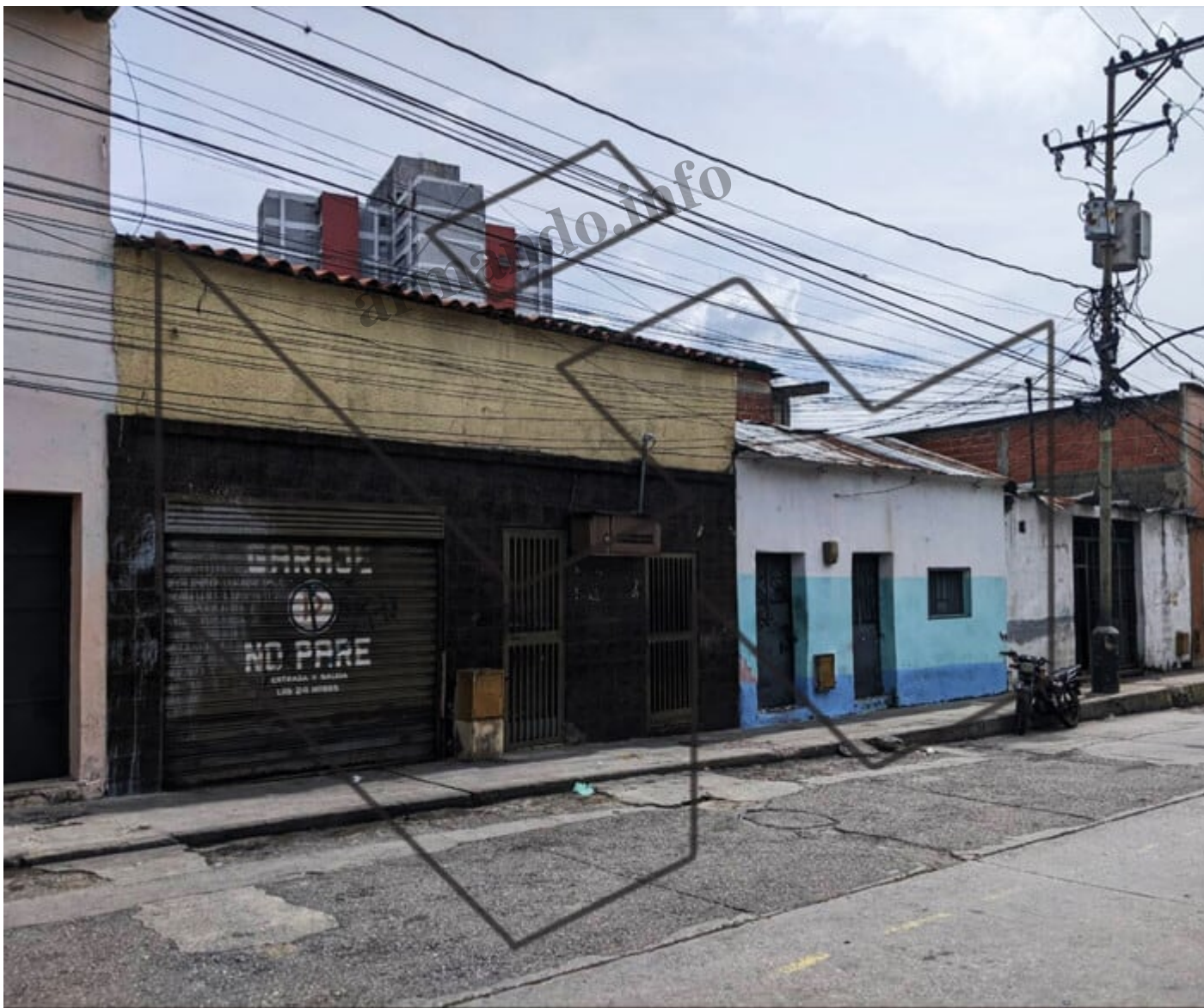
Una modesta casa en Sarría es la sede de Walker Internacional, trader que ha