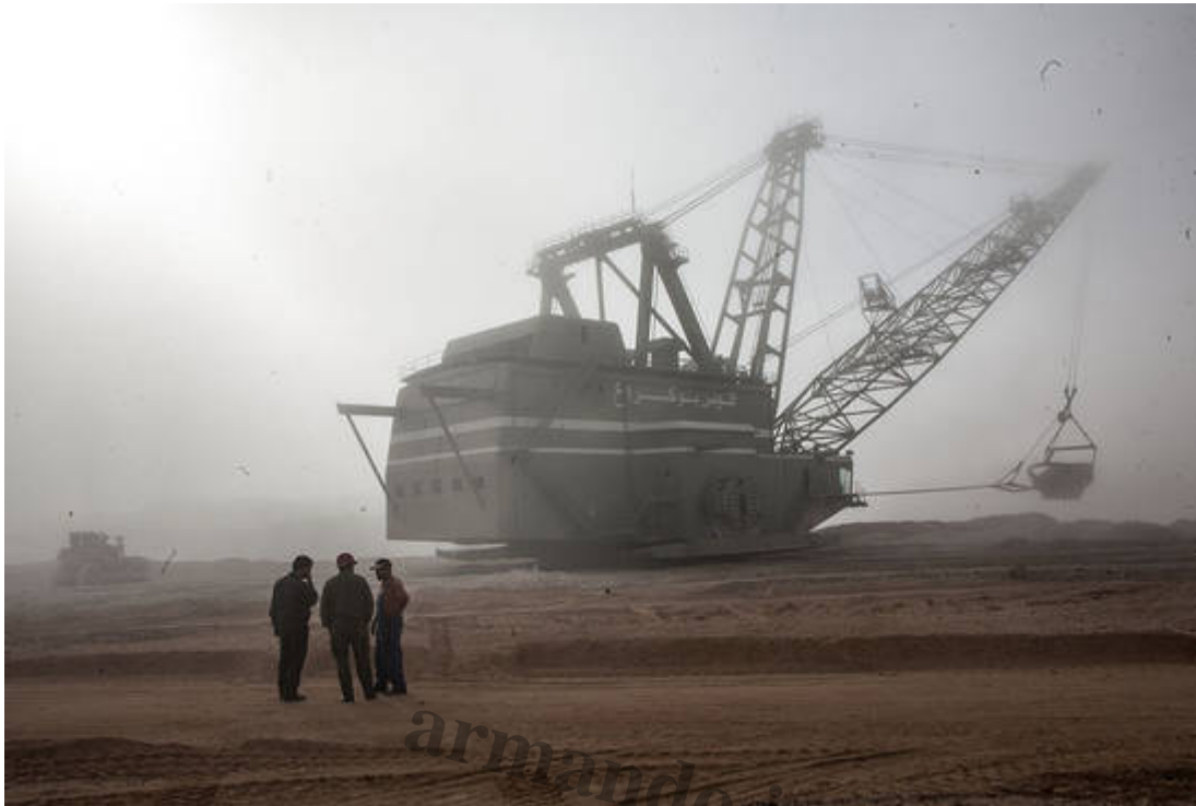
La Organizaci3n de Naciones Unidas (ONU) ha condenado en diversas declaraciones la extracci3n de los recursos naturales del S3hara Occidental.

No obstante, Daha destaca el apoyo que Venezuela ha brindado a la liberaci3n saharai desde 1982, cuando Caracas reconoci3 a la RASD como pa3s soberano. La diplomacia bolivariana ha ido m3s all3: el 17 de septiembre de 2011 inaugur3, en alianza con Cuba, la Escuela Sim3n Bol3var para m3s de 350 alumnos de 4 wilayas, como se conoce a los asentamientos de refugiados que se establecieron en un pedazo de Argelia.