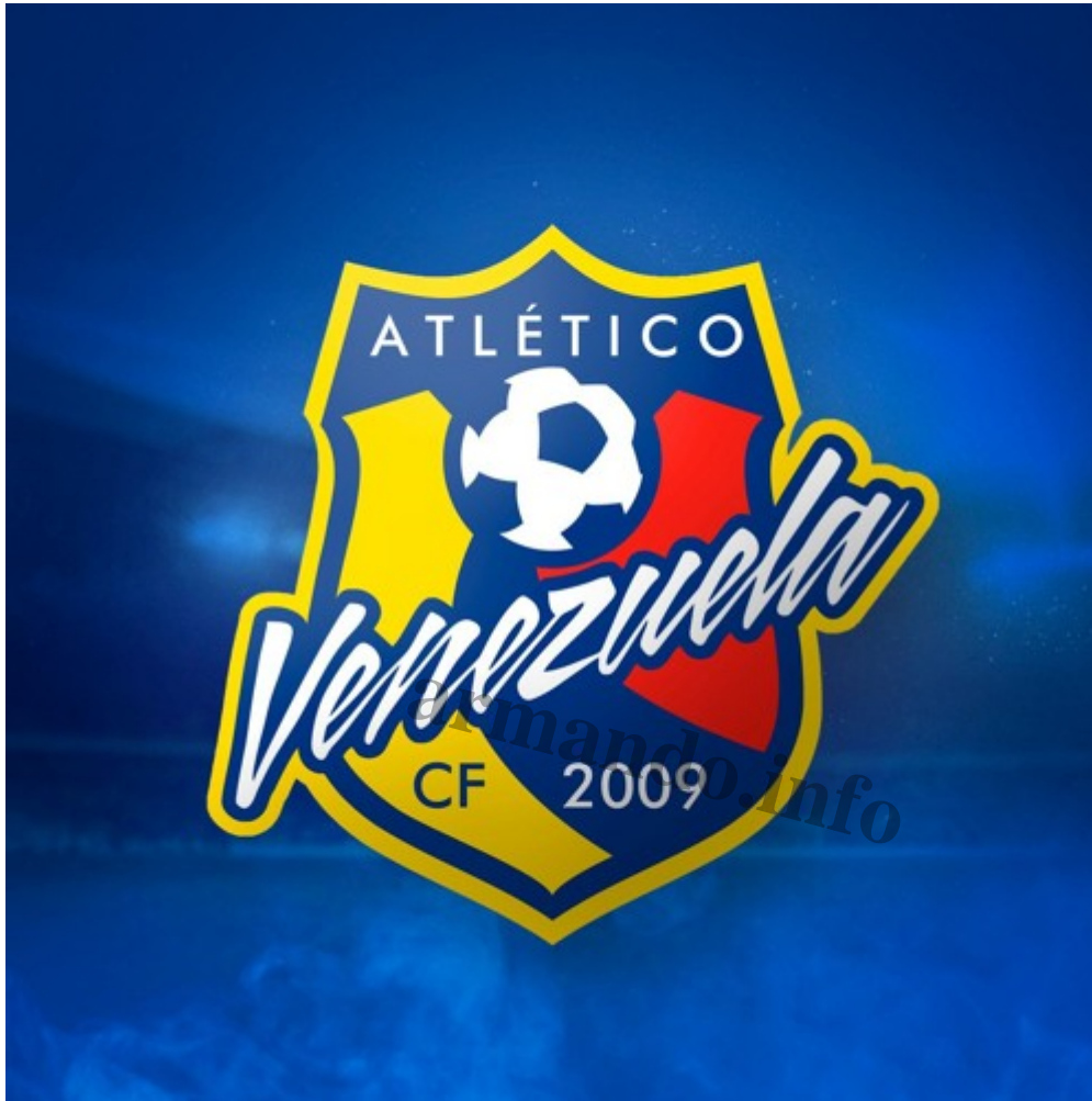
Atlético Venezuela Club de Fútbol