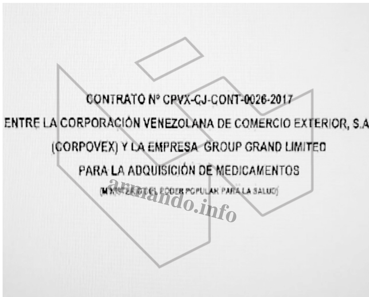
Contratos de Group Grand Limited con Corpovex