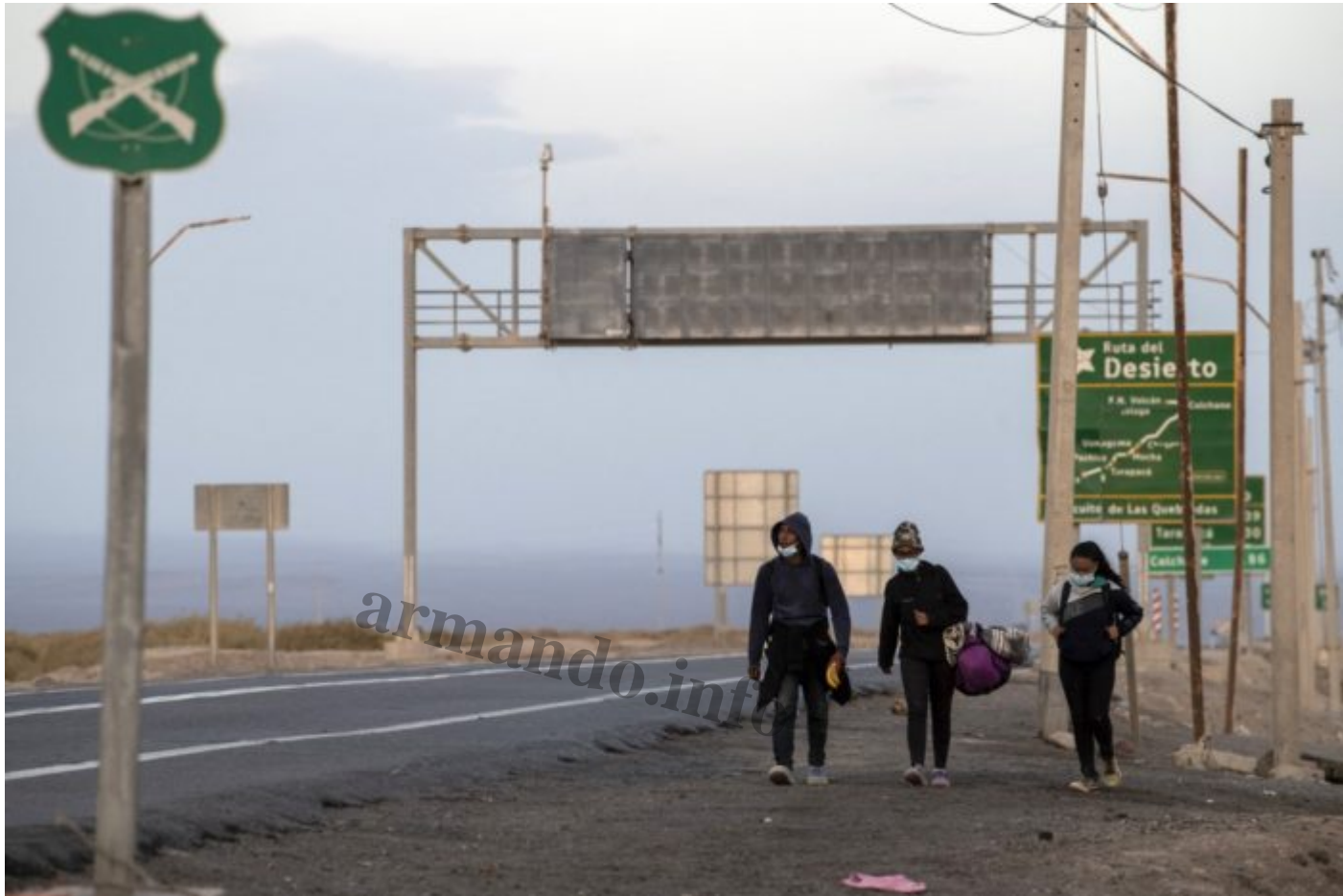
Los caminantes atraviesan la frontera de noche para no ser vistos por la policía.