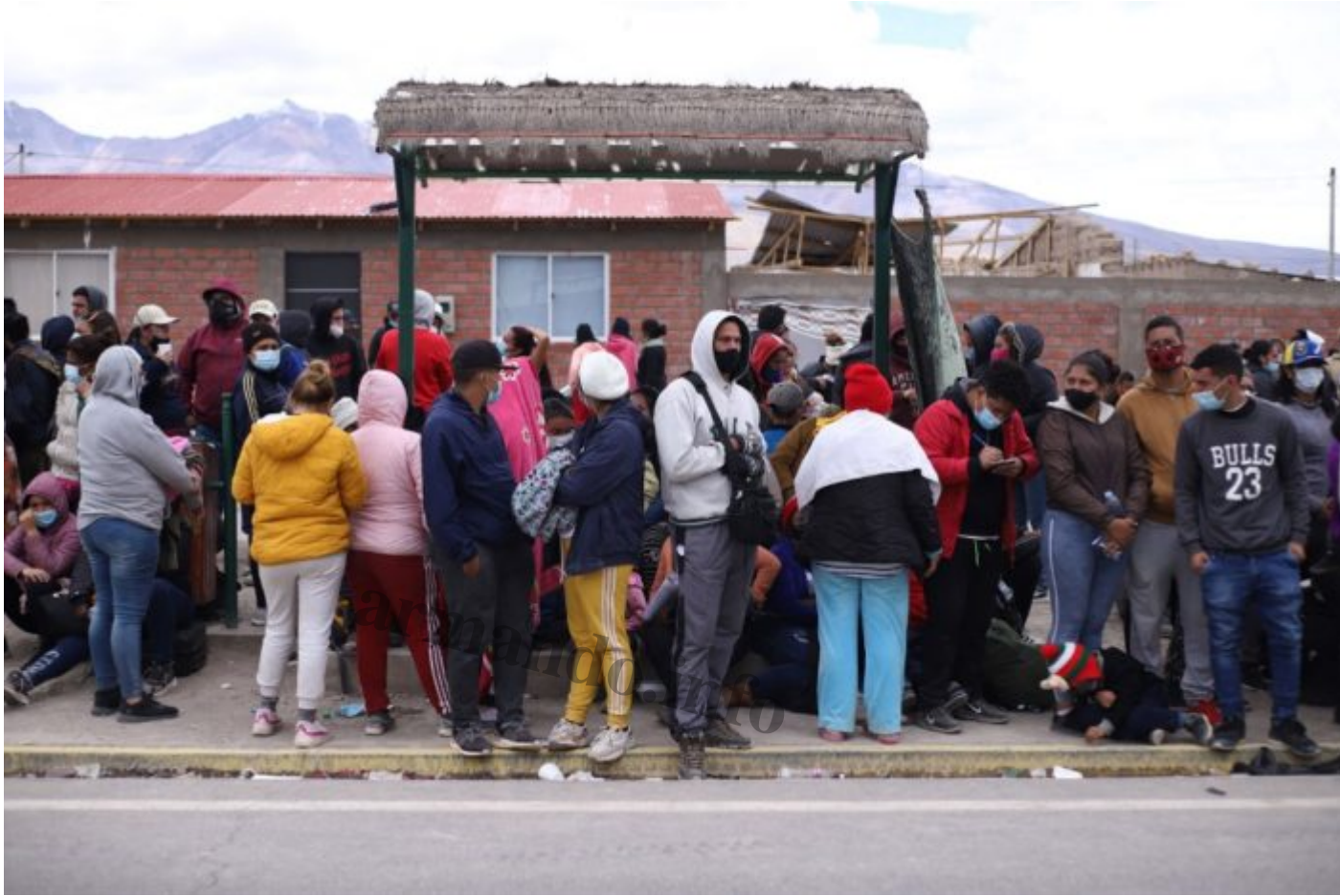
Al entrar a la frontera chilena los migrantes deben reportar que entraron de manera ilegal.