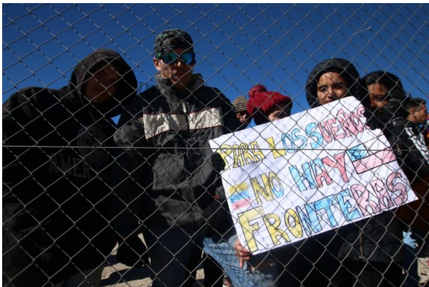
Al entrar a la frontera chilena los migrantes deben reportar que entraron de manera ilegal.

Así que siguieron bajando al sur del continente. En noviembre del año pasado Albanis se armó de valor, abrazó a su bebé, con solo cinco meses de nacido, y entró al desierto boliviano-chileno con su pareja y la ayuda de una mujer colombiana.