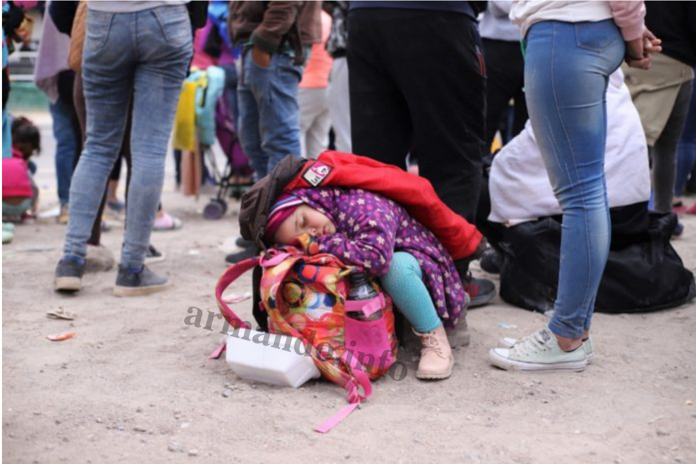
Los chilenos nunca antes habÃ±an visto a niÃ±os cruzando la frontera sin sus padres.