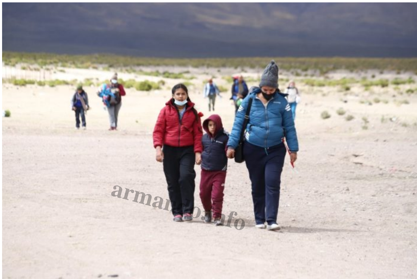
Los chilenos nunca antes habÃ±an visto a niÃ±os cruzando la frontera sin sus padres.

La benevolencia tiene un lÃ±mite. El 20 de abril se promulgÃ³ una nueva Ley de Migraciones. Esta normativa establece que los migrantes que ingresaron con pasaporte o tarjeta de identidad antes del 18 de marzo de 2020 pueden obtener una visa. Pero los migrantes que ingresaron a Chile por pasos no habilitados tienen un plazo de 180 dÃ±as para salir del paÃ±s y acudir a un consulado chileno en el exterior para solicitar una visa. Se dio comienzo a las deportaciones.