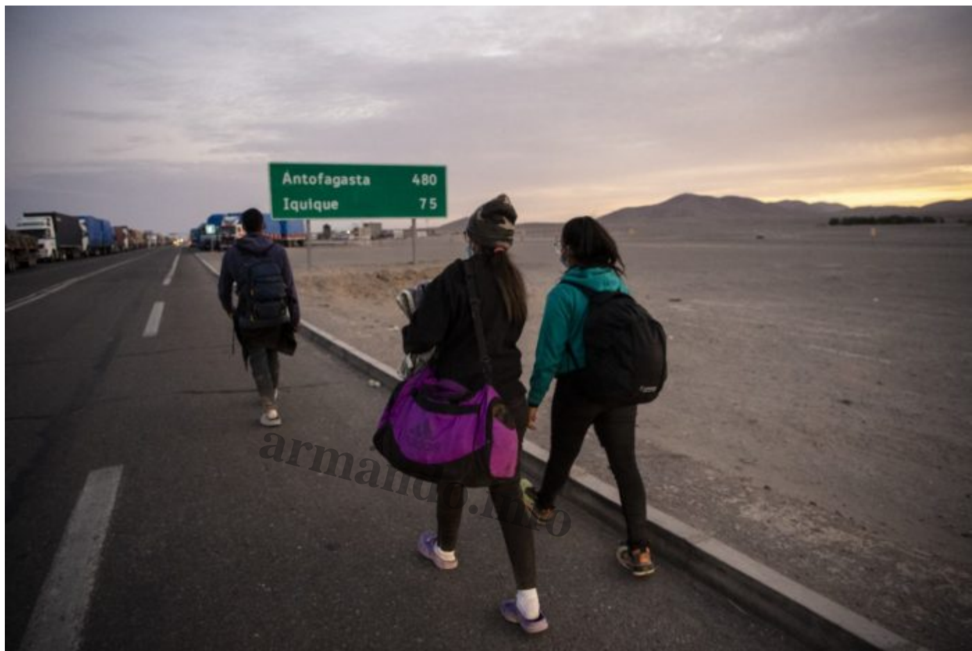
Los caminantes atraviesan la frontera de noche para no ser vistos por la policia. Foto: Martn Bernetti / AFP.