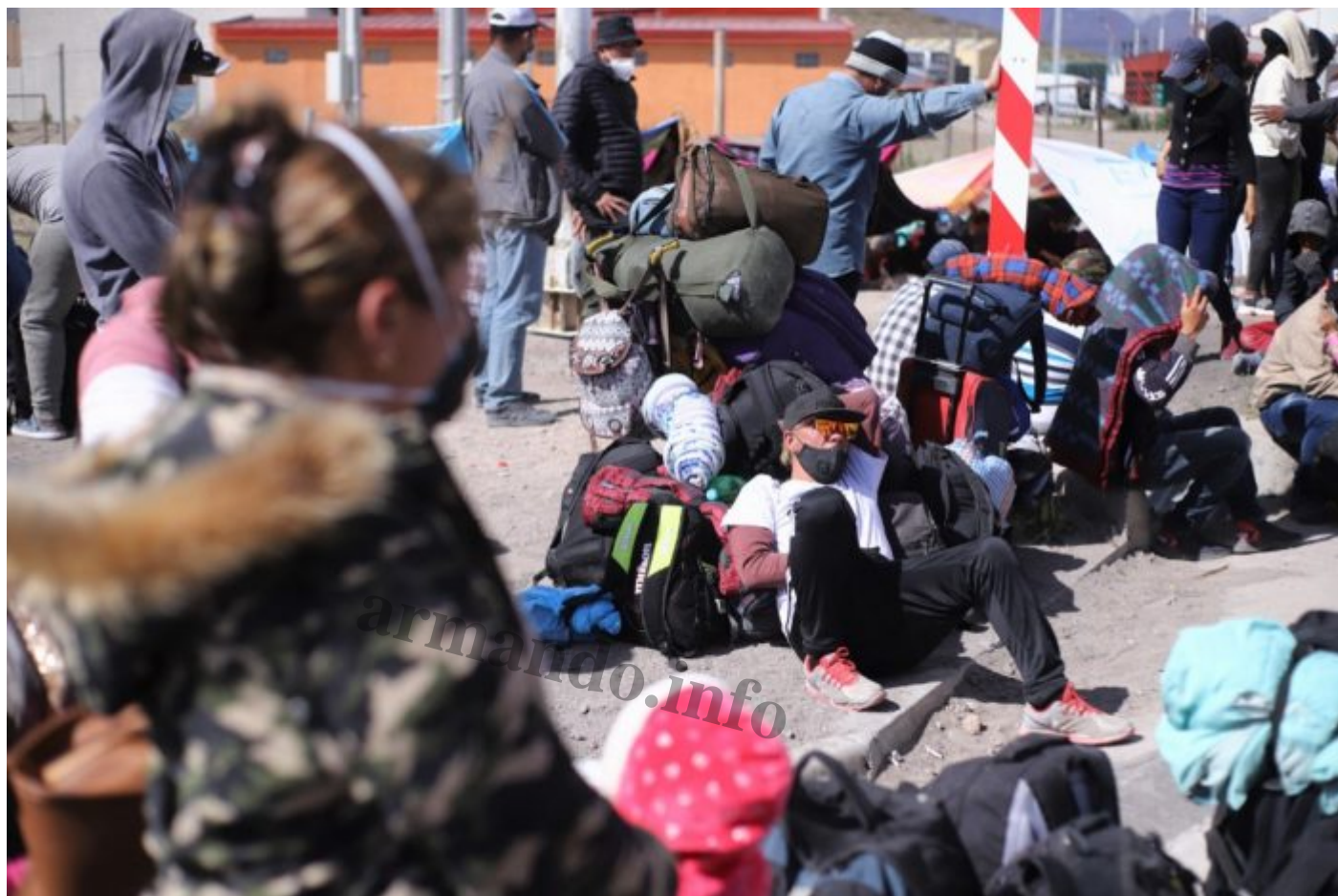
Al entrar a la frontera chilena los migrantes deben reportar que entraron de manera ilegal.

Para pasar la frontera caminÃ³ durante cinco horas, aferrada a su hijo. Con mucho miedo. Ya habÃa presenciado meses atrÃs, tambiÃn como caminante, cÃmo a una mujer se le muriÃ su bebÃ congelado en los brazos despuÃs de dejar Pamplona, en la provincia de Norte de Santander, Colombia. â??Ella siguiÃ caminando cargando a su bebÃ muerto porque no lo querÃa dejar. Cuando llegamos al primer pueblito ella simplemente cayÃ al piso y ahÃ se quedÃ. Fue como cuando alguien se desvanece y muereâ?, rememora.