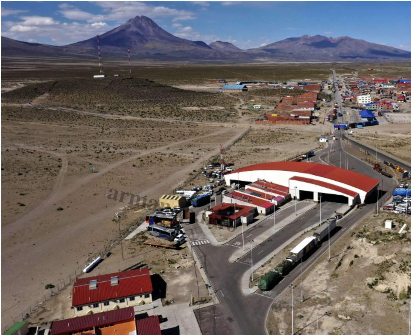
Colchane es un pueblito con escasos 1.600 habitantes y un solo dispensario de salud. Foto: Mart n Bernetti / AFP.

El  nico dispensario de Colchane colapsa. Pasaba de atender a 10 pacientes al d a, a tratar a 20 pacientes, casi siempre venezolanos. Por lo general no pueden respirar, est n descompensados o les atormentan las enfermedades cr nicas que no se atienden desde hace mucho tiempo y que los rigores del camino han agudizado.