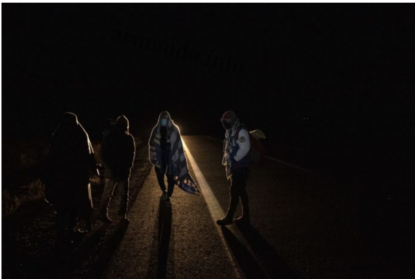
Los caminantes atraviesan la frontera de noche para no ser vistos por la policÃa.

El tercer muerto tiene menos historia. O FromentÃn no la conoce. El cadÃ¡ver llegÃ³ el 25 de abril sin identificaciÃ³n y sin familiares.