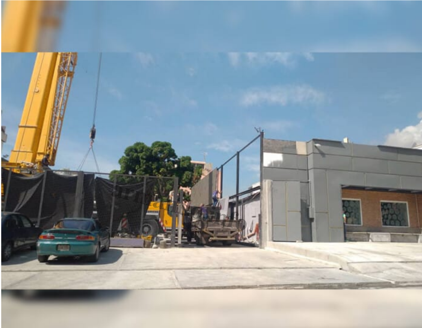
Fachada de la quinta Tolosa, donde funciona Altum, y de la quinta Noya, alquilada para Buono Restaurante. Cr dito: Armando.info