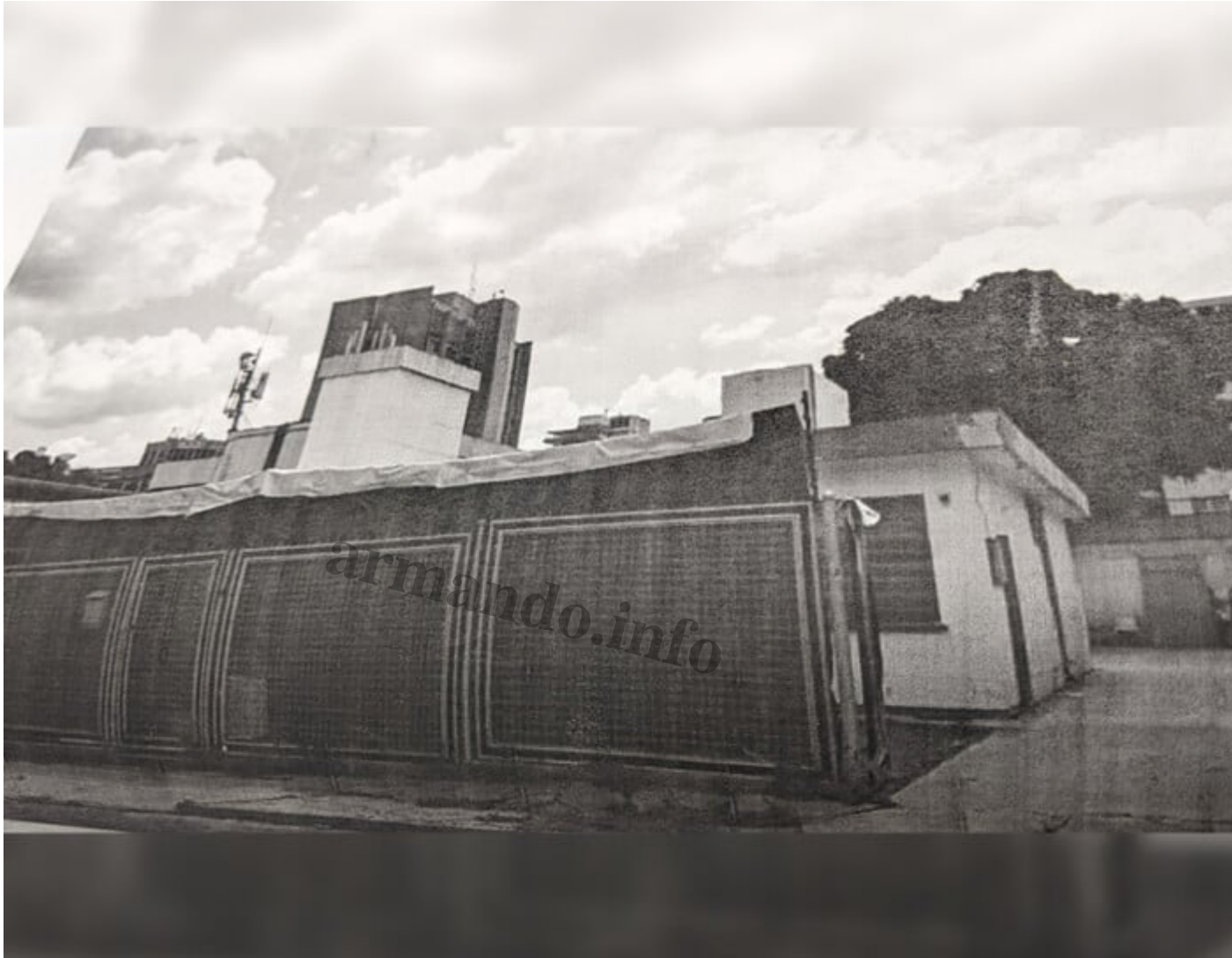
Fachada de la quinta Tolosa donde existi  una casa que fue derribada y en el terreno montaron Altum. Cr dito: Armando.info.