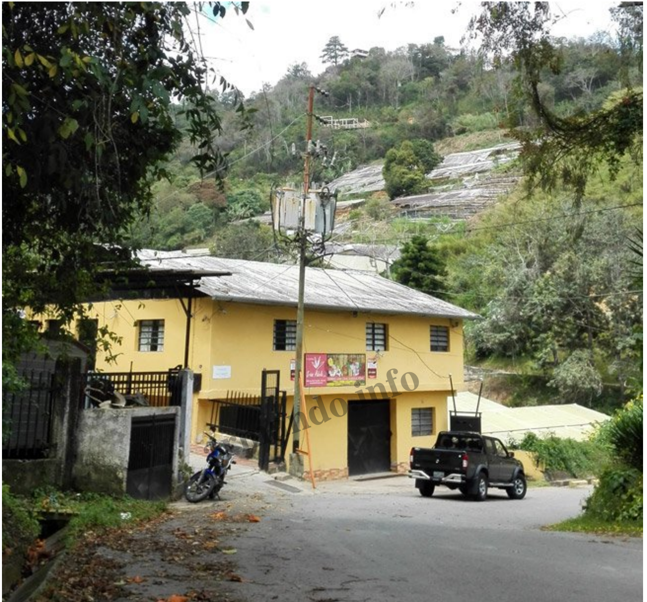
Fachada de la casa de cultivo.