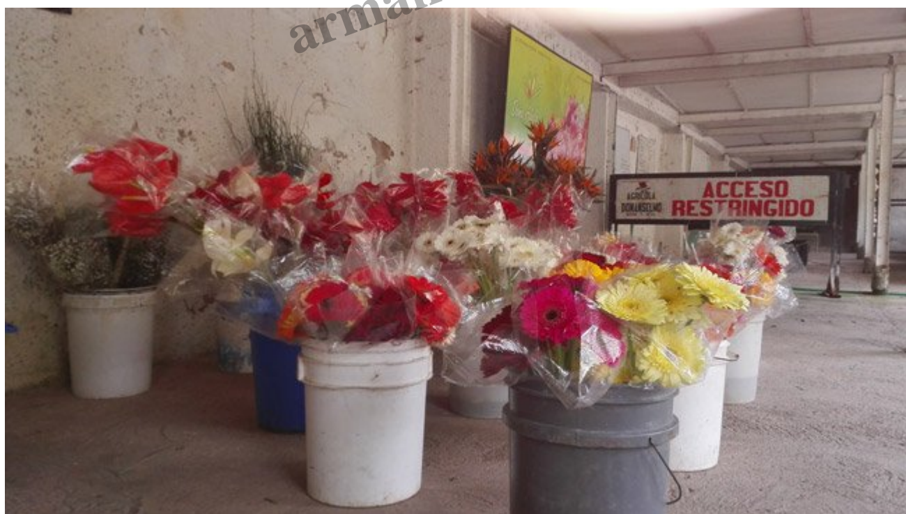
En el galpón de la distribuidora sólo hay un par de envases llenos de gerberas y calas.

La distribuidora intenta sobrevivir con el comercio interno y se encuentra en conversaciones para importar a los Estados Unidos. "A la empresa Orquídea se le despachó un par de veces, tenían