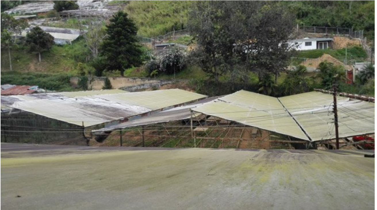
Así se encuentran las casas de cultivo. Desde la carretera se pueden apreciar los espacios entre los techos el estado de estos galpones.