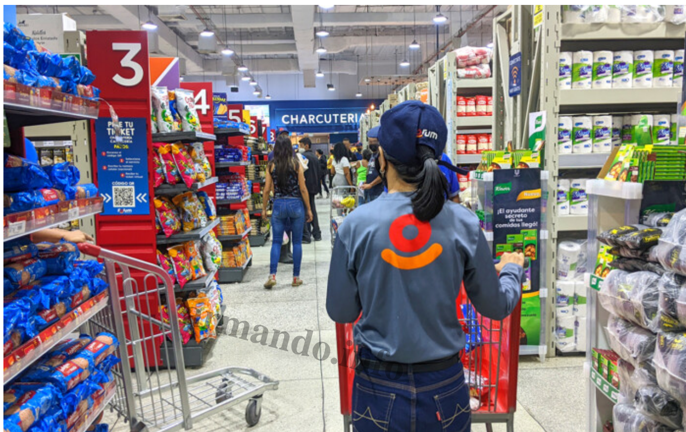
En la sede de Forum en San Bernardino (Caracas) funcionaba antes una Tienda CLAP. Cr dito: Armando.info

Las coincidencias entre Salva Foods y Forum se hacen m s llamativas con lo que delatan las facturas. En distintas compras efectuadas, por una parte, en las tiendas en Salva Market del Centro Ciudad Comercial Tamanaco (Chua, Caracas) y de Las Mercedes; y, por otra parte, en las Forum Shop del Centro Comercial Multiplaza Para so y de Los Pr ceres, la direcci n fiscal a la que todas las facturas remiten es la misma: la oficina  nica en el piso 15 del Centro Altamira.