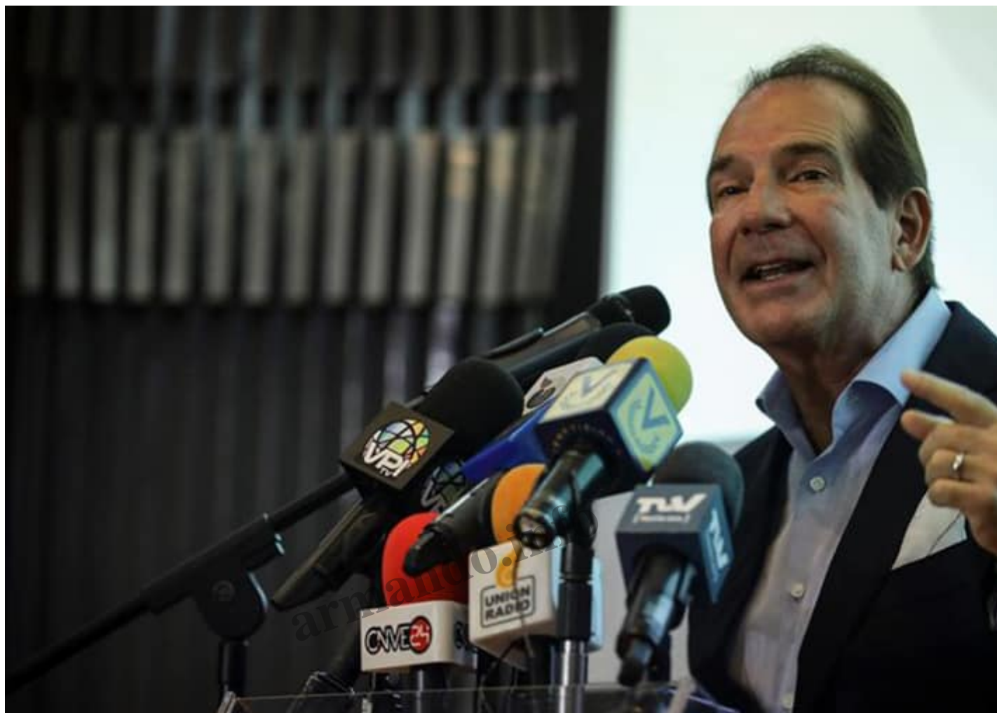
El banquero Víctor Vargas intenta no perder su imperio financiero.

Entre tanto, fuentes en Panamá aseguran que la Fiscalía contra el Crimen Organizado se dispone a solicitar medidas de privación de la libertad contra Vargas. En ese país y en Curazao, acreedores del Allbank y el Banco del Orinoco han radicado demandas civiles para recuperar sus fondos, iniciativas a las que apenas consiguió apaciguar por unas semanas el anuncio en mayo pasado de que el Orinoco y sus 1.900 acreedores -entre ellos, casi 1.500 cuentahabientes - habían alcanzado un acuerdo de pago. De haber tal acuerdo, sus términos no se han cumplido por el momento, lo que transgrede por mucho el plazo que los boletines de prensa de Vargas habían establecido para su culminación: a más tardar, julio de 2021.