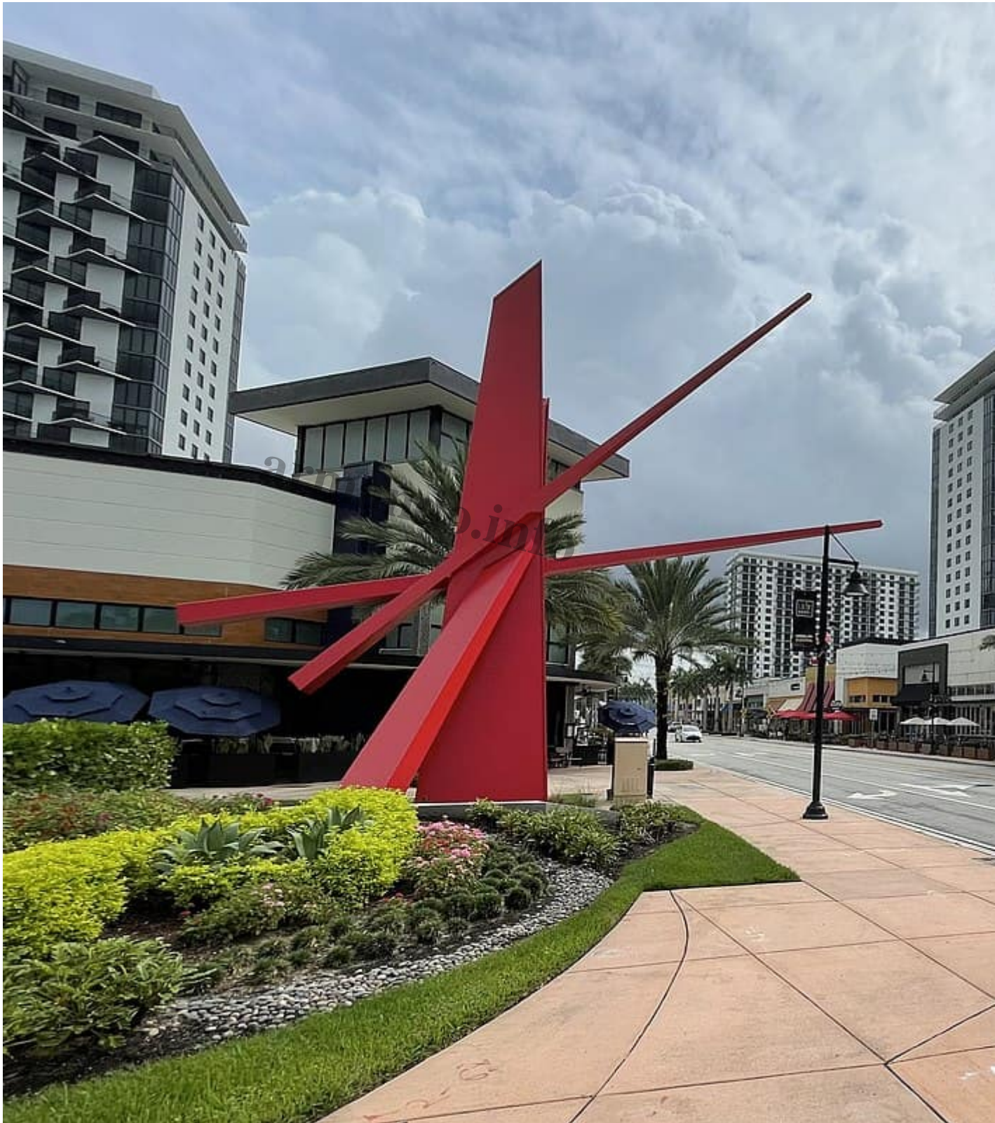
Imagen del centro de Doral, junto a Weston, el anclaje de los venezolanos en el sur de Florida y, no en vano, apodada como 'Doralzuela'. Cr dito: Richard N Horne/Wikimedia Commons.

La Plataforma de Coordinaci3n Interagencial para Refugiados y Migrantes de Venezuela de Naciones Unidas ya contabiliza 7,1 millones de venezolanos en el exterior. En Estados Unidos hay 484.445