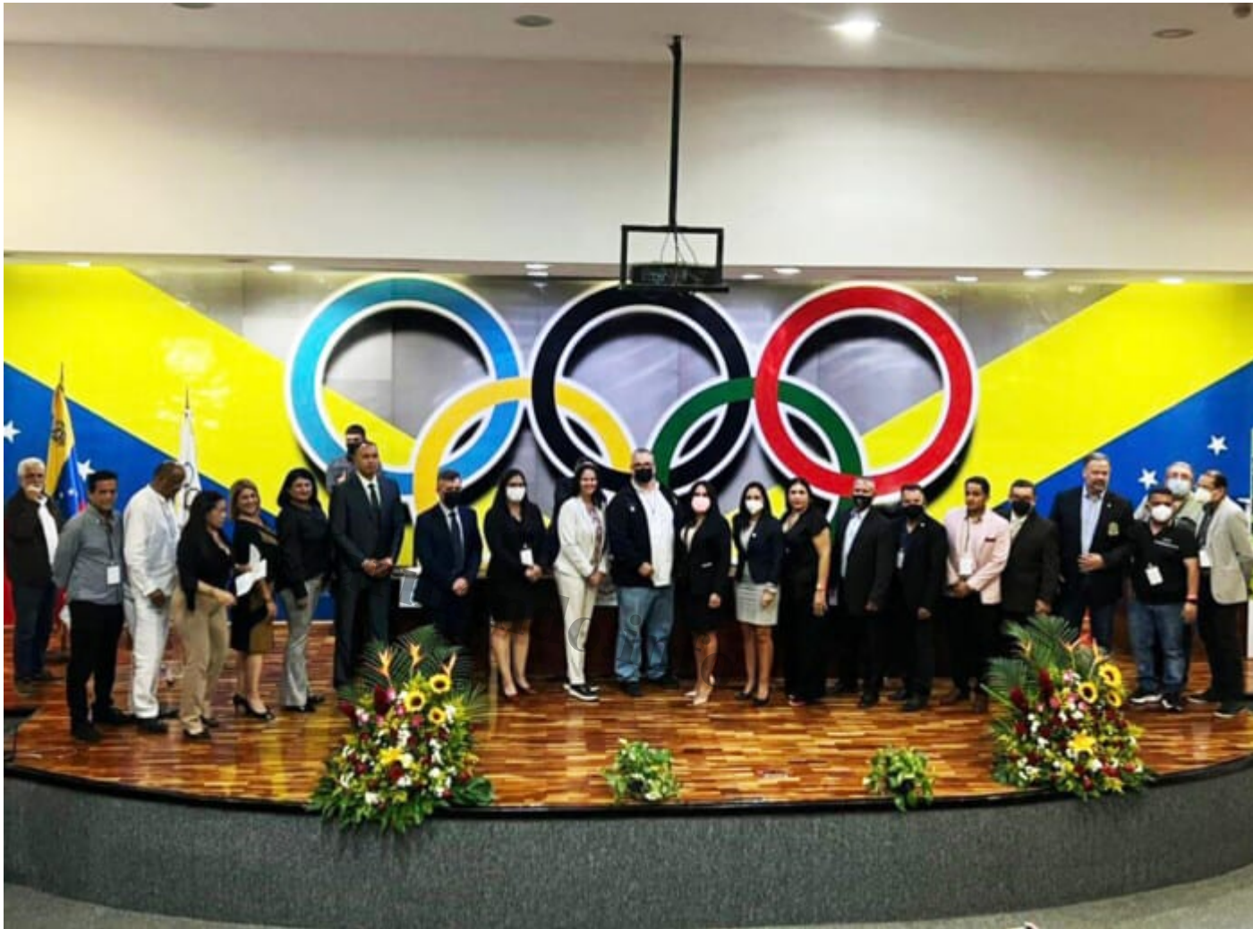
El nuevo COV electo el 19 de mayo fue reconocido por el Comit  Olimpico Internacional. Cr dito: Twitter Nicol s Maduro