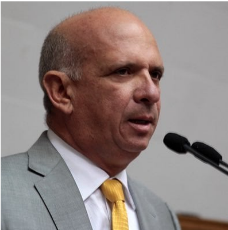
Hugo 'el pollo' Carvajal.