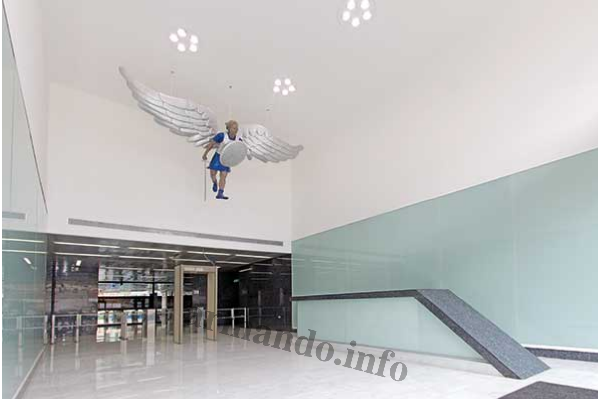
Escultura de San Miguel Arcangel en la Torre SMA en Las Mercedes, Caracas.