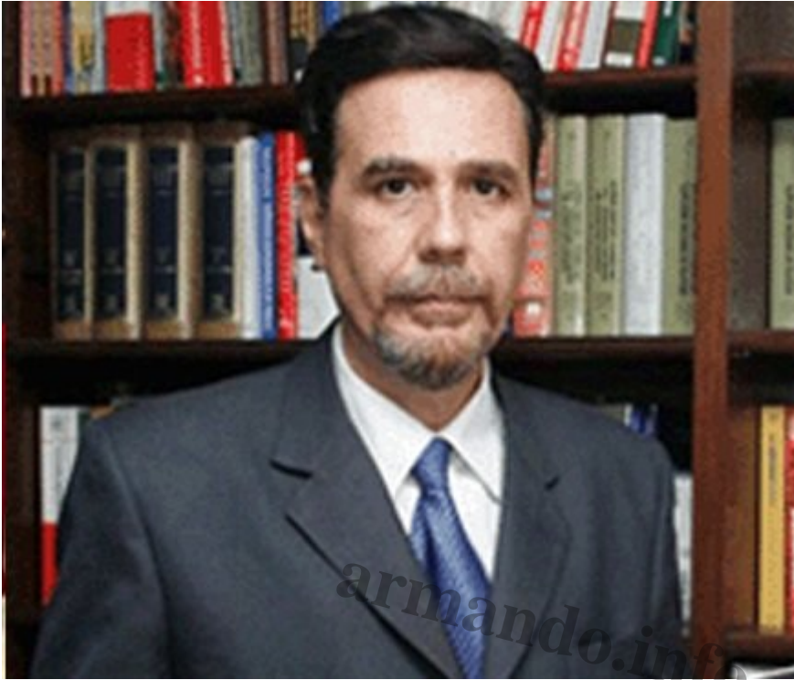
El exmagistrado Marco Tulio Dugarte