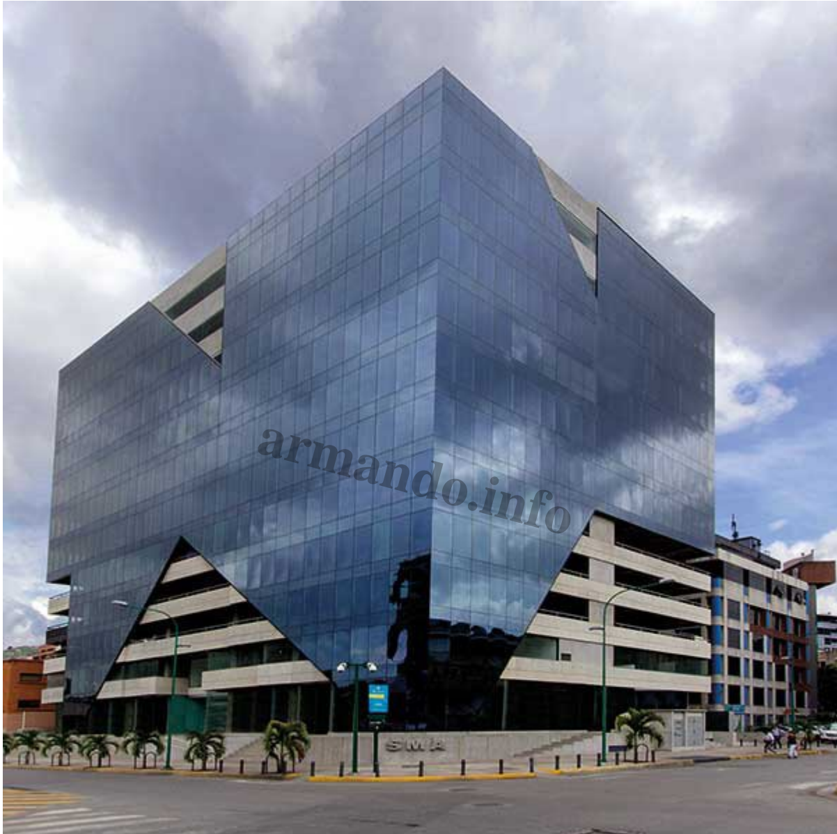
Torre SMA en Las Mercedes, Caracas.