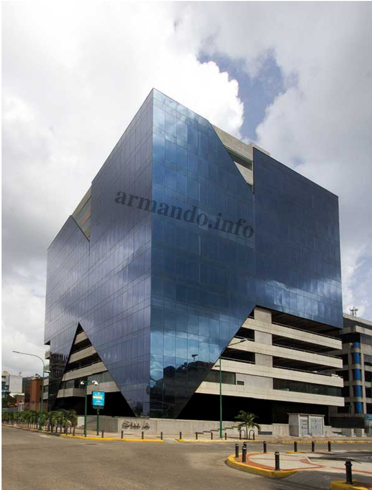
Torre SMA en Las Mercedes, Caracas.