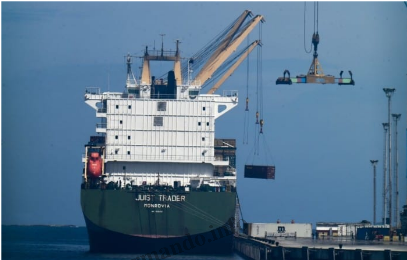
Sultán Cohén tuvo como socio a Majed Khalil Majzoub, quien comparte apellido y relaciones comerciales con Majed Khalil Majzoub.