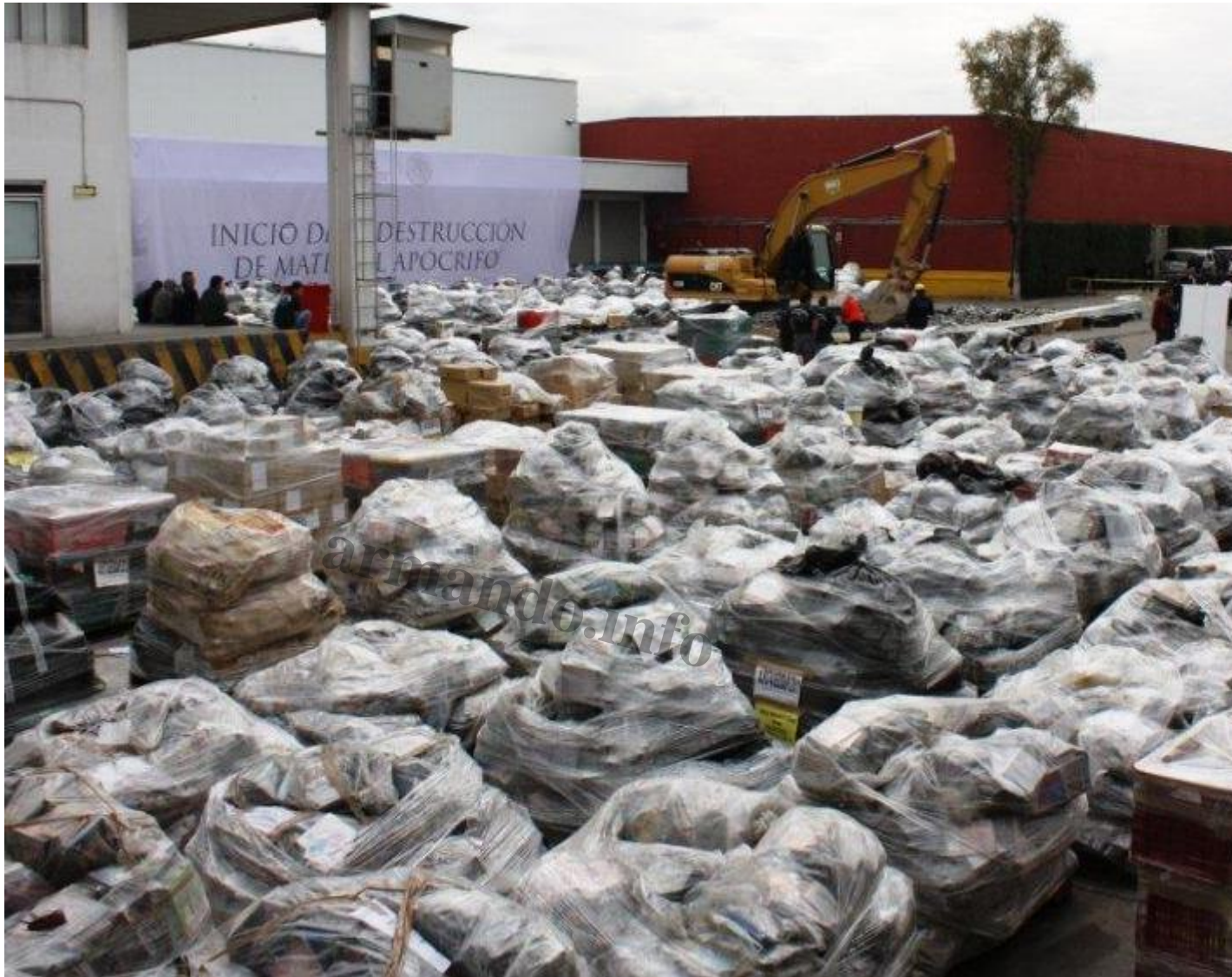
Paquetes en el patio de almacén de la PGR con bienes incautados a los carteles del narcotráfico.