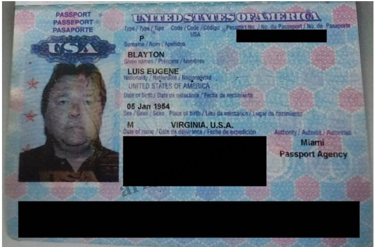
Blayton es de nacionalidad americana

“La operación se realizó dentro de la legalidad, los vehículos le fueron entregados a las autoridades municipales de entonces en perfecto estado y así fueron recibidas por ellas, entregando el documento de descargo”, comentó al respecto el gabinete de crisis que representa a Díazgranados.