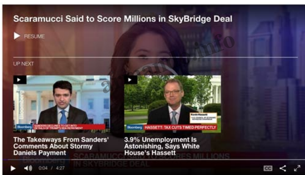
Scaramucci Said to Score Millions in SkyBridge Deal

A few days after Anthony Scaramucci lined up a top job in Donald Trump's White House, he struck a multimillion-dollar deal to exit his investment firm, selling part of his interest to a little-known company, RON Transatlantic EG.