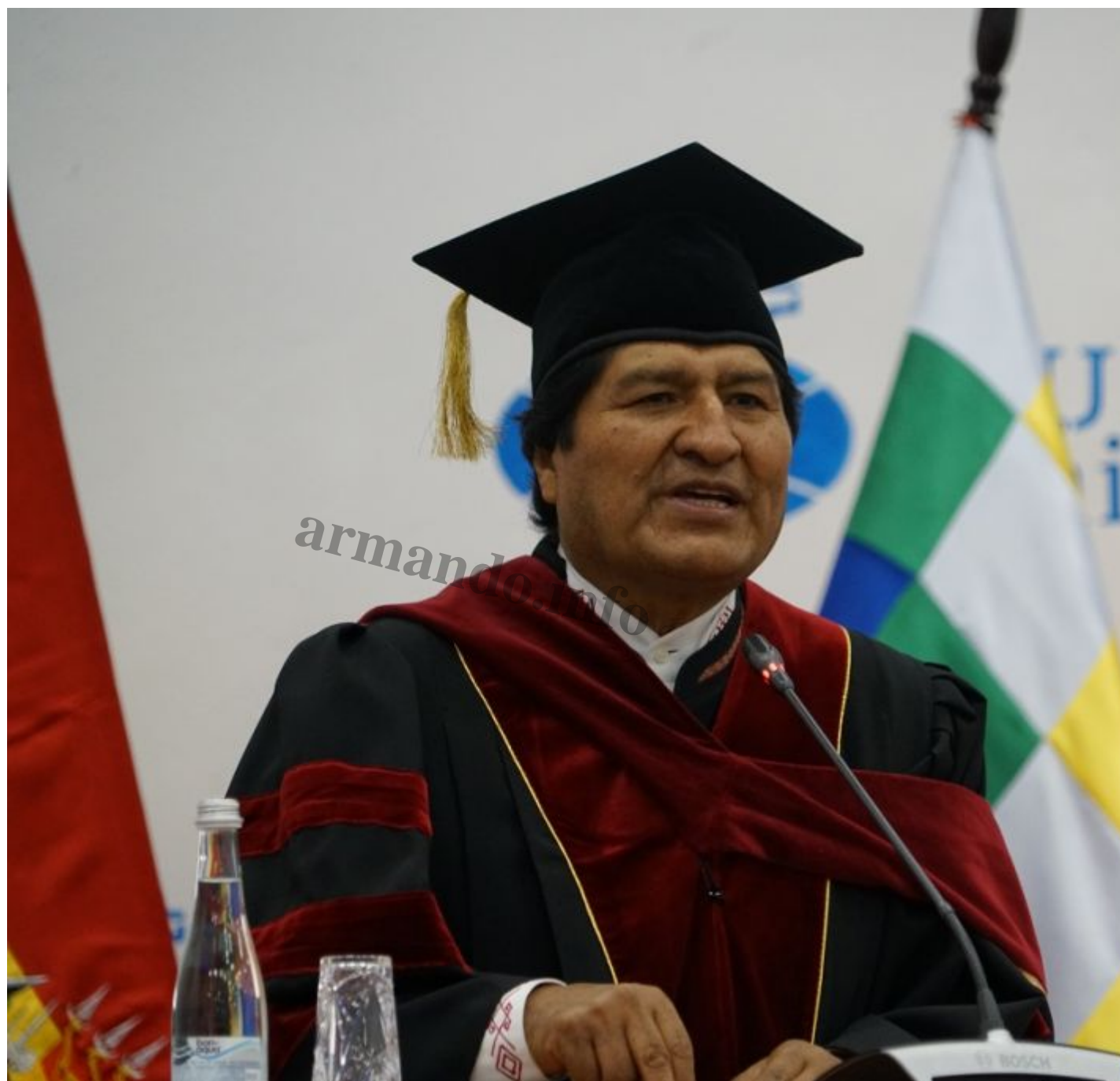
Evo Morales en la ceremonia de entrega del título de doctor honorífico en Moscú

Morales ha ocupado la presidencia de su país durante tres períodos consecutivos, a pesar de no ser algo muy consistente con la Constitución boliviana. Pero la mayoría de los bolivianos desde hace mucho tiempo le perdonan casi todo a Morales gracias a que bajo su mandato el estándar de vida se elevó considerablemente debido principalmente al alza de los precios del gas y del petróleo.