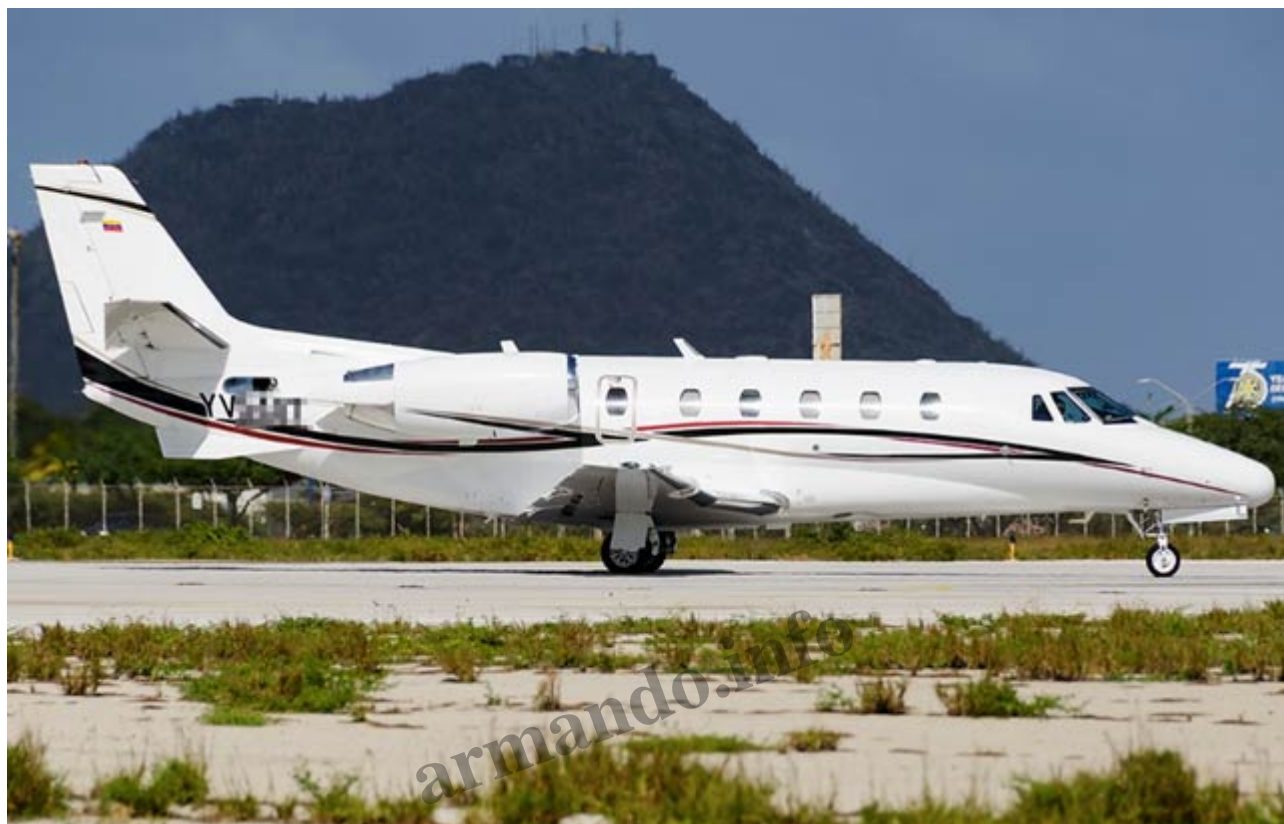
Tomada en el aeropuerto de Aruba el 8 de marzo 2017 por @nilo

Ha viajado en una aeronave de fabricación americana, pero Estados Unidos no aparece entre sus destinos en la última década.